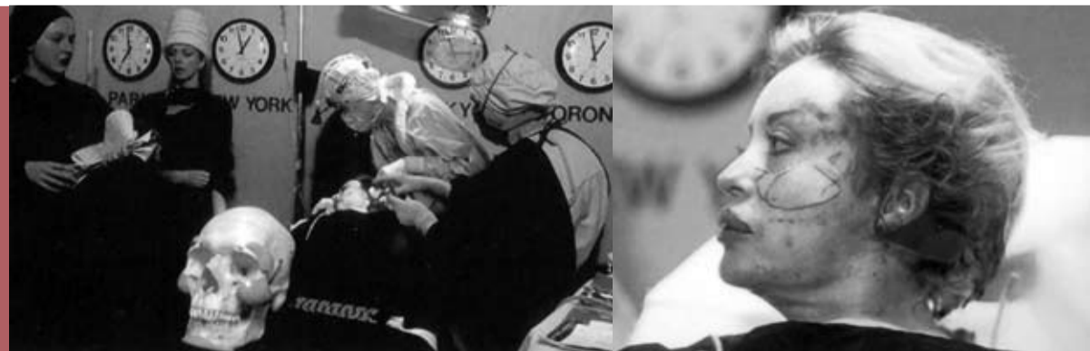
Orlan, fotoilustracija za Carnal Art Manifesto ili Smiling at the Open Body without Pain , 1993